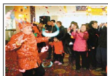
百岁老太生日宴上又唱又跳