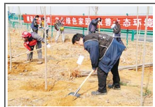
中日青年生态绿化工程