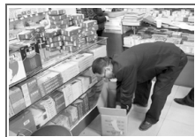
市民反映药店全松茶是 ...