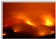
丽江大火火线达数百米