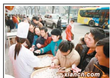
元宵节西安老字号食品 ...