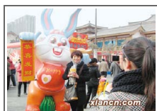
市民在发财兔旁拍照留 ...