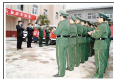
丹凤消防迎来首批现役官兵